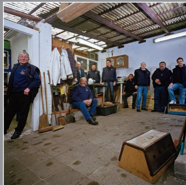
Kaninchenzüchter, Recklinghausen, 2008