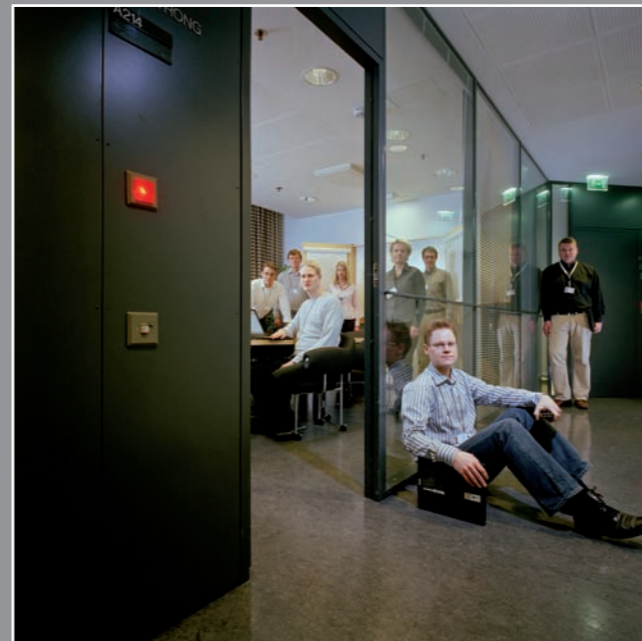
Ingenieure im Nokia-Forschungszentrum, Helsinki, 2008