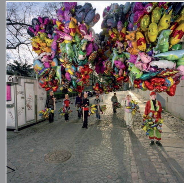
Ballonverkäufer am 1. Mai, Helsinki, 2000

Kunstaussstellung zu den Ruhrfestspielen Recklinghausen 2009