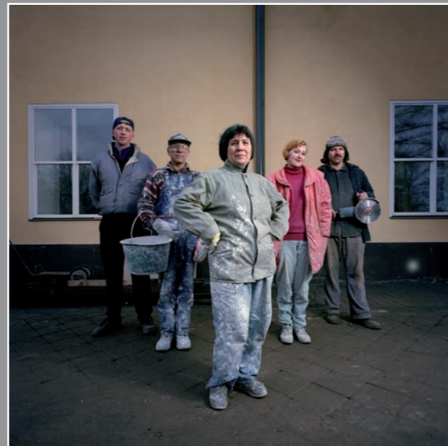
Renovierungstrupp, Riga, 1997