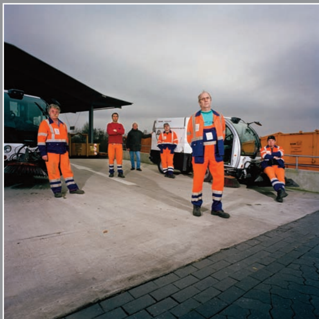
ESR-Reinigungsbetriebe, Recklinghausen, 2008