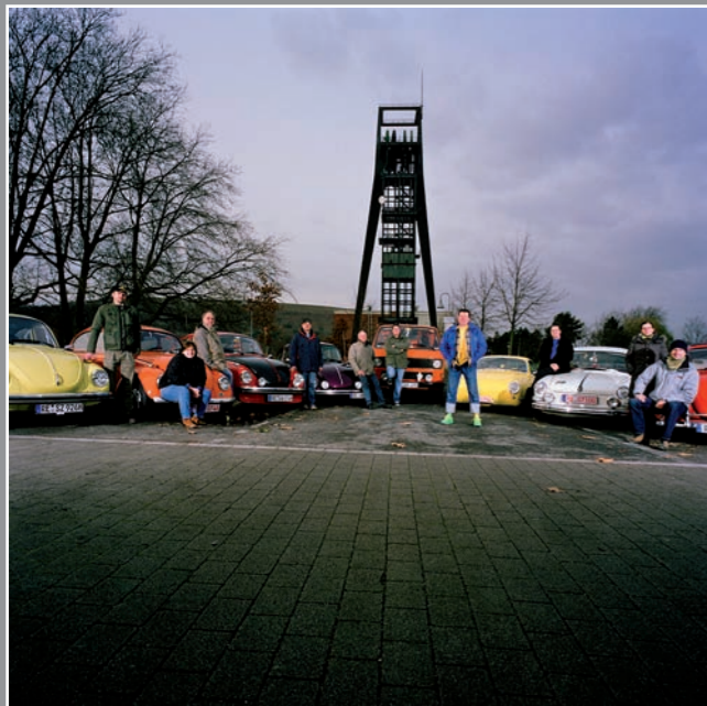
Käfer Club, Recklinghausen, 2008