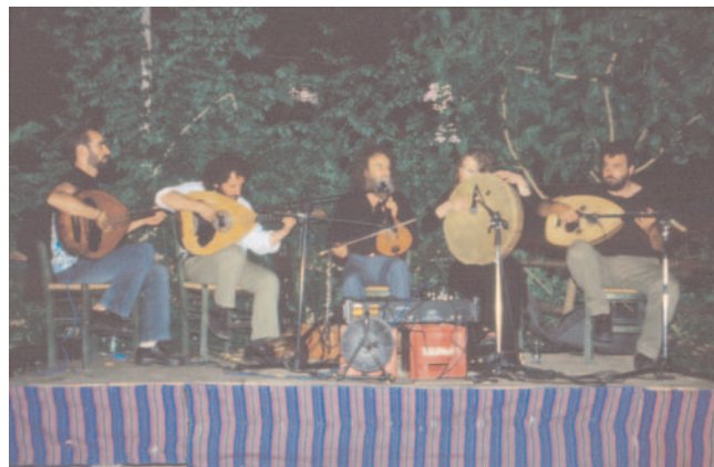
Psarandonis und Ensemble

Eintrittskarten bei den üblichen Vorverkaufsstellen und an der Abendkasse (ab August)