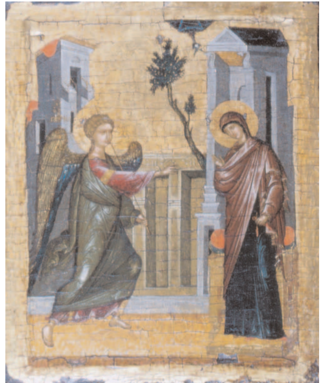
Verkündigung an Maria, Griechenland (Kreta), 2. Hälfte 15. Jahrhundert, Eitempera auf Holz, 31 x 25,5 cm (Inv. Nr. 91)

Die Gesellschaft EIKON – Freunde der Ikonenkunst e.V. ist der Förderverein des Ikonen-Museums. EIKON unterstützt die Aktivitäten des Museums durch Ankäufe, Schenkungen und Förderung von Ausstellungsvorhaben. Mitglieder von EIKON werden kostenlos durch das Ikonen-Museum beraten und haben freien Eintritt in die Recklinghäuser Museen.