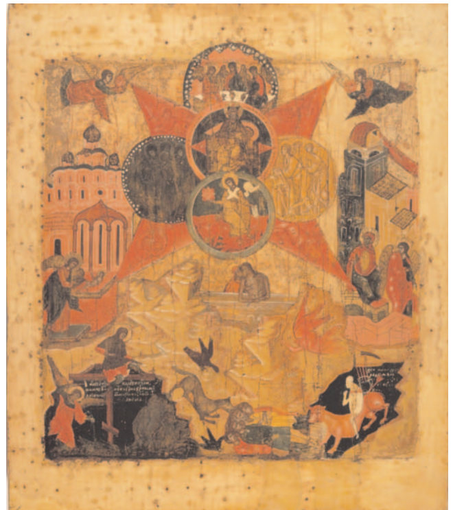
Eingeborener Sohn, Wort Gottes, Russland, 3. Viertel 17. Jahrhundert, Eitempera auf Holz, 56 x 47 cm (Inv. Nr. 407)