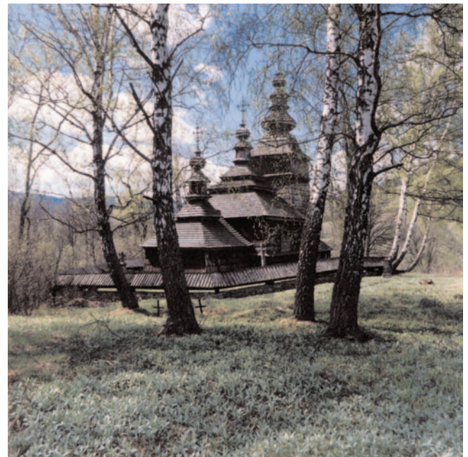
Kirche der Hll. Kosmas und Damian, Kotan (Woj. Krosno), Polen, Aufnahme: Siegfried von Quast

Briefmarkenschau des Briefmarkensammler-Vereins Recklinghausen e.V. Rathaus der Stadt Recklinghausen, 1. Stock Neben anderen Jubilaren wird sich auch das Ikonen- Museum präsentieren.