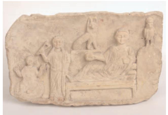
Gabrelief Terenuthis, um 200 n. Chr., Kalkstein, 25,5 x 44 x 7 cm (Inv. Nr. 564)

Führungen werden auch in englischer, französischer, pol- nischer und serbischer Sprache sowie in Deutscher Gebärdensprache angeboten.