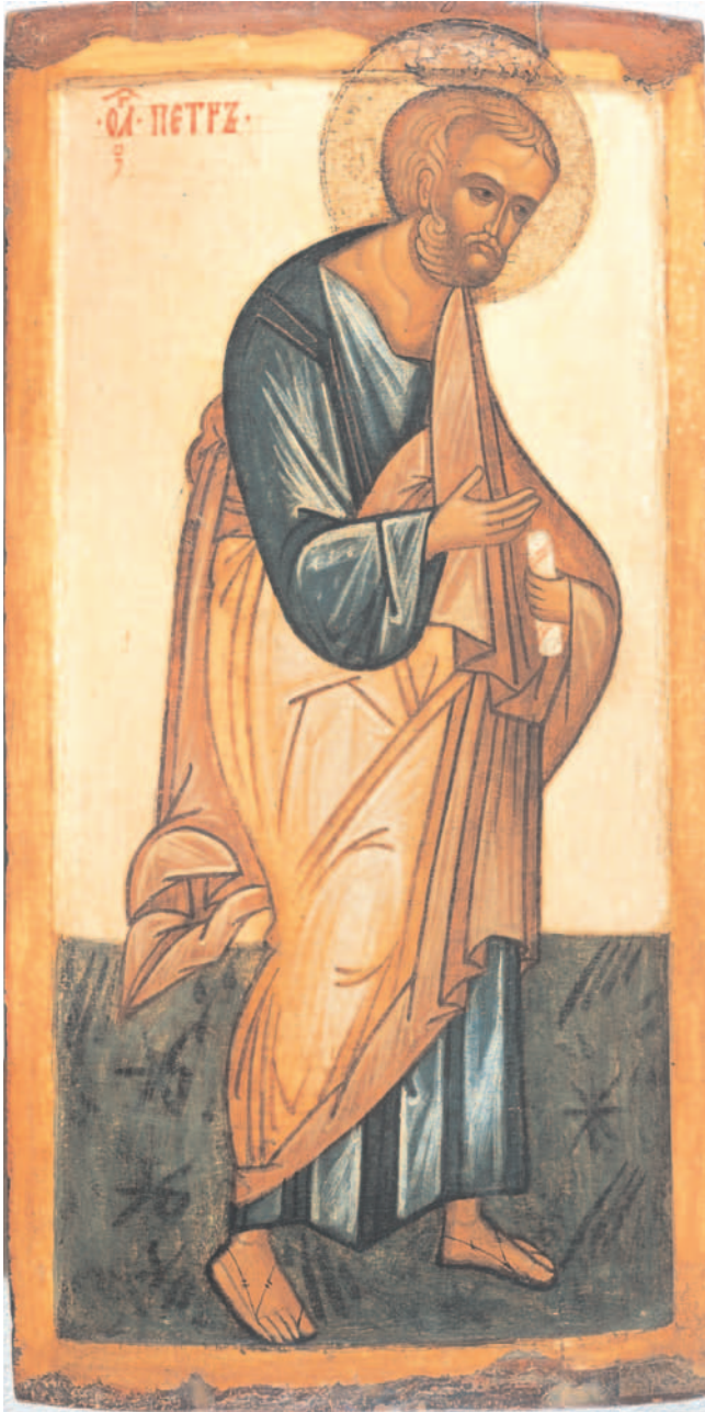
Apostel Petrus, Russland (Novgorod), Ende 15. Jahrhundert, Eitempera auf Holz, 89 x 44 cm (Inv. Nr. 854)