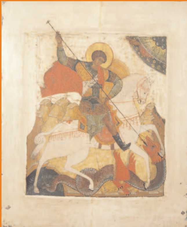
Der Drachenkampf des hl. Georg, Russland (Novgorod), Anfang 16. Jahrhundert, Eitempera auf Holz, 31,5 x 26,5 cm (Inv. Nr. 436)

In der Ikonenmalerei erscheinen immer wieder unterschiedlichste Tiere und Wesen, die in religiösen Geschichten eine bedeutende Rolle spielen. Diese gilt es auf einer Reise durch die Ausstellung zu entdecken und später zu einem eigenen Werk zu gestalten.