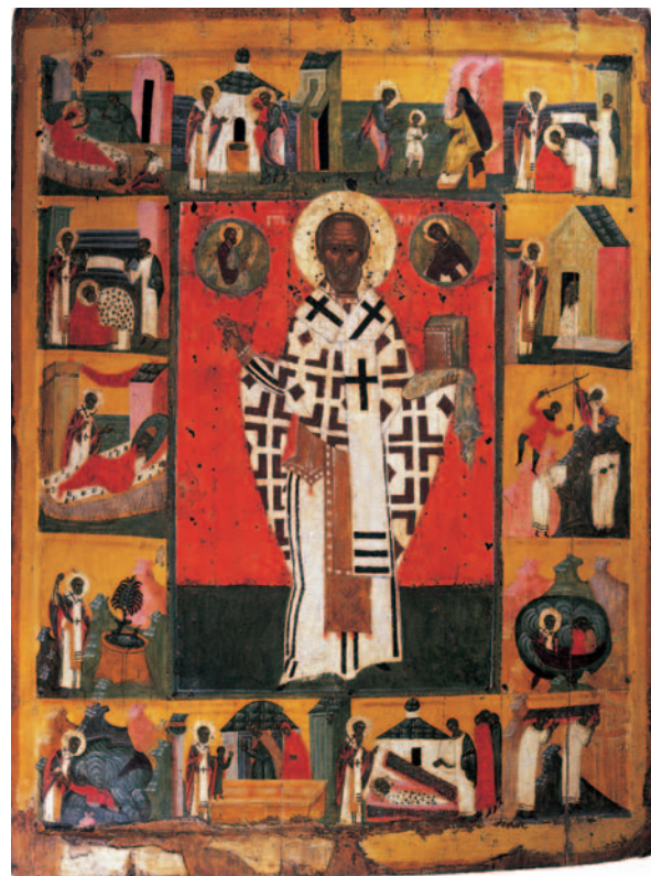
Hl. Nikolaus mit Szenen aus seinem Leben, Nordrussland, Ende 15. Jahrhundert, Eitempera auf Holz, 92 x 70,5 cm (Inv. Nr. 432)