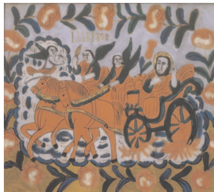
Die Himmelfahrt des Propheten Elija, Rumänien (Gherla), 2. Hälfte 19. Jahrhundert, Hinterglasmalerei, 43,6 x 48,5 cm (Inv. Nr. 1129)