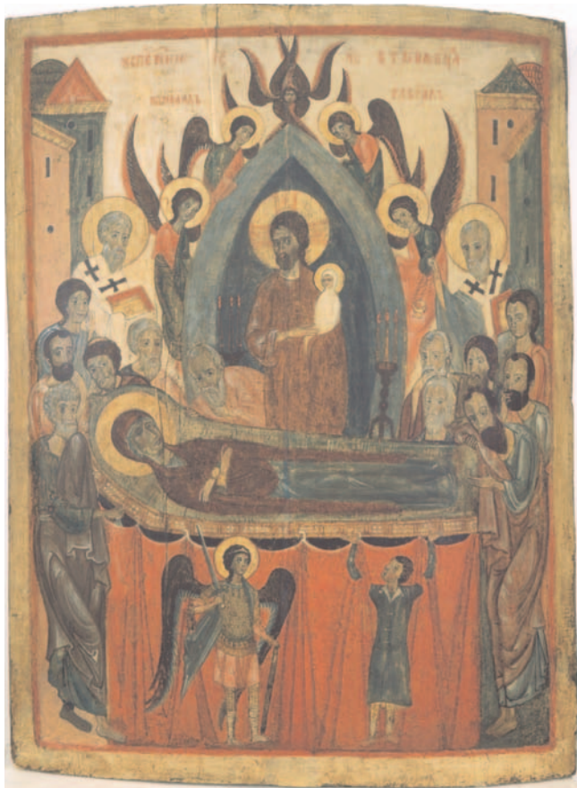
Das Entschlafen der Muttergottes, Russland, Ende 13./Anfang 14. Jahrhundert, Eitempera auf Holz, 90,3 x 67 cm (Inv. Nr. 450)

50 Jahre Ikonen-Museum Recklinghausen 1956 bis 2006