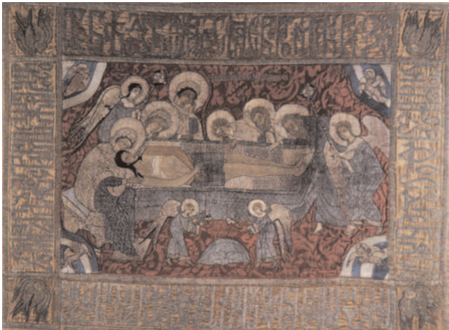
Epitaphios, Russland, um 1600, Stickerei, 83 x 113 cm (Inv. Nr. 901)

Im Jubiläumsjahr wird zusätzlich ein Audioguide erstellt.